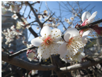
冬… 冬の自然を再発見！