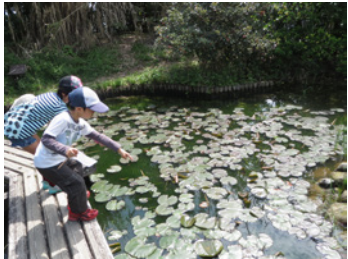
春… ビオトープを探検しよう

自然の中には「楽しい！」「おもしろい！」がいっぱい！自然楽校から帰ったあとも、ぜひおうちで学校で公園で、いろんな楽しい！を探してみてください。自然楽校での体験が、身近な自然に関心を向けるきっかけになればとてもうれしく思います。