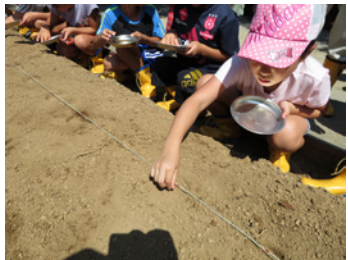
秋… 野菜の種をまこう