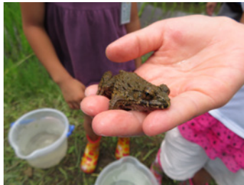
夏… 田んぼの生き物観察